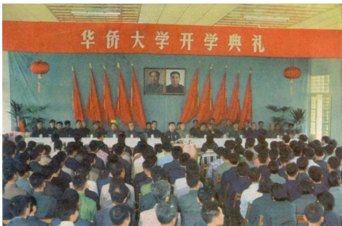
1978 年 10 月，学校在教工餐厅里举行复办后首个开学典礼

1978 年 9 月，学校复办后首批招收的数学系、化学系、土木系 181 名学生按时入学（土木系暂借福州大学上课）。10 月 23 日，华侨大学在数学楼前举行了隆重的复办挂牌典礼，华侨大学重获新生。