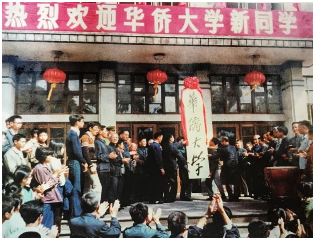
1978 年 10 月 23 日，华侨大学在数学楼前隆重举行复办挂牌仪式

1970 年 1 月，华侨大学被迫撤销停办，位于泉州的校址整体移交给 1969 年由福建医学院和福建中医学院合并组建的福建医科大学使用。