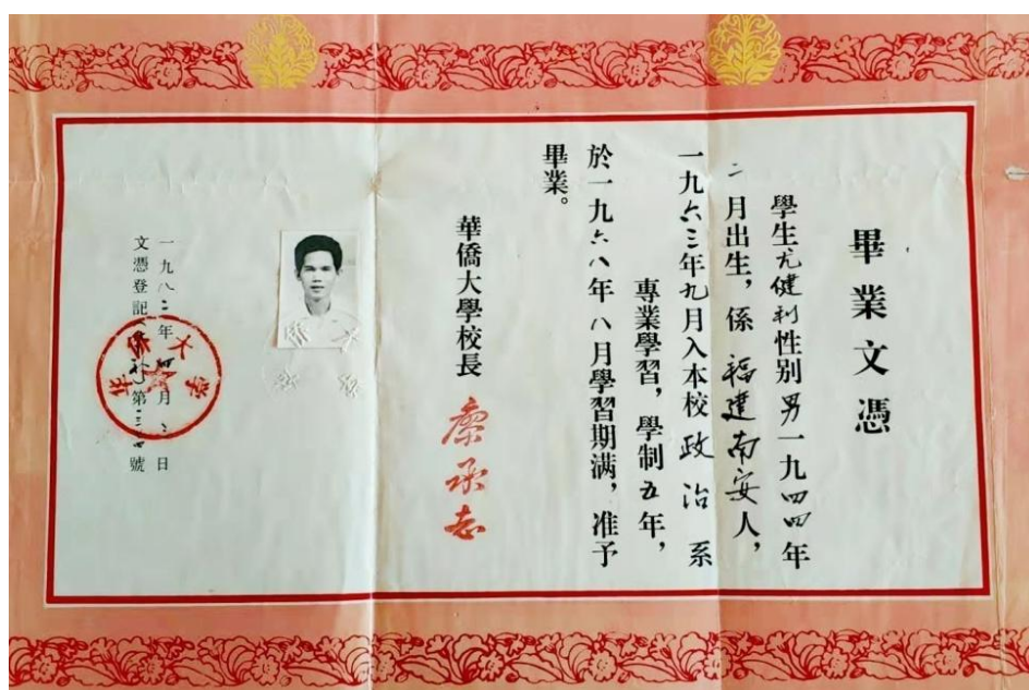
图四：1982 年学校为 68 届毕业生补发的毕业文凭