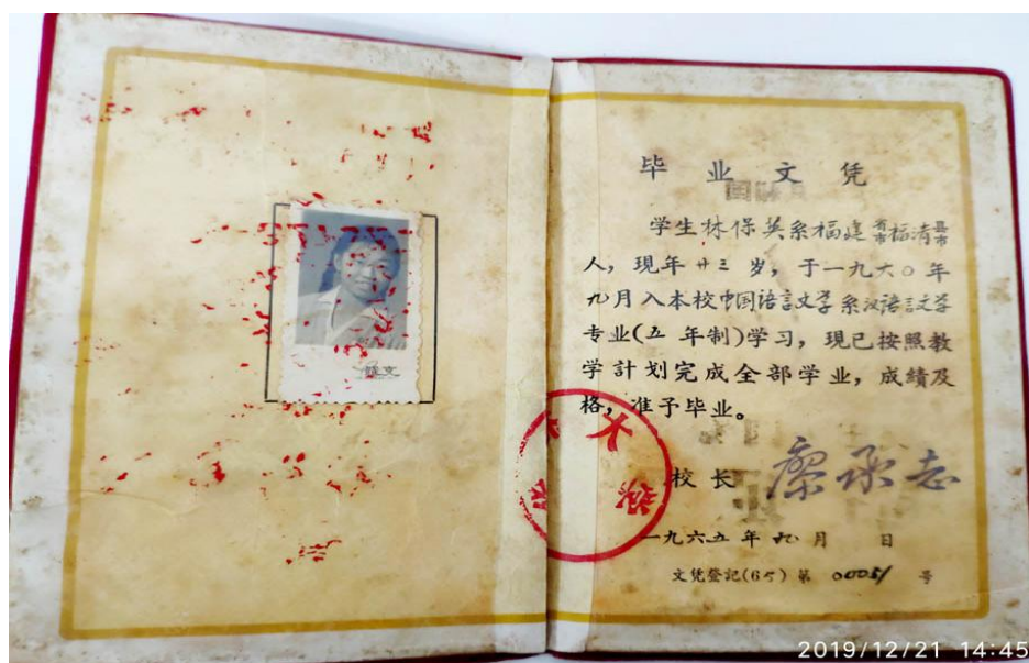
图一：我校首届毕业生的毕业证书

1965 年夏，华侨大学迎来了办学史上的首届毕业生，他们是来自中文系汉语言文学专业的 61 名归国华侨学生。9 月，学校向每位毕业生颁发了有廖承志校长签名的毕业文凭（图一）。