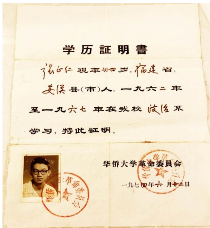
图二：1974 年华侨大学革委会开具的学历证明

随后华侨大学的六届（1966—1971 届）毕业生毕业时，因为适逢“文革”，学校停课闹革命，正常办学秩序遭受到严重冲击，故没有发放毕业文凭。1970 年学校停办后，在原校址设立留守处处理后续事宜，一些校友曾到学校申办学历证明，获得批准（图二）。